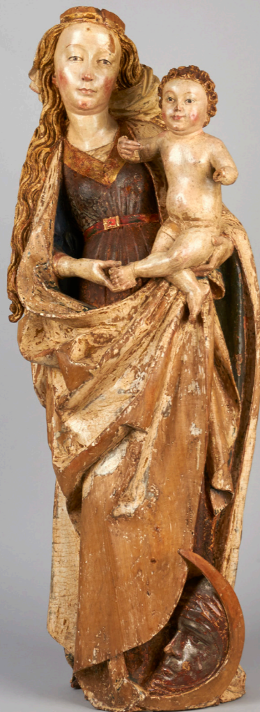
Madonna con il Bambino, statua lignea, Yvo Strigel di Memmingen (Germania), 1495, proprietà: parrocchia di Villa di Chiavenna.

generazioni dei secoli scorsi hanno consegnato al nostro tempo. Siamo anche convinti di avere il diritto e il dovere di tramandare questo patrimonio alle generazioni future, intatto, possibilmente migliorato e godibile per tutti. Pensiamo inoltre che le opere d’arte conservate nel museo siano della società civile nel suo complesso, segno, oltre che della nostra religiosità, anche della nostra cultura e dei nostri valori.